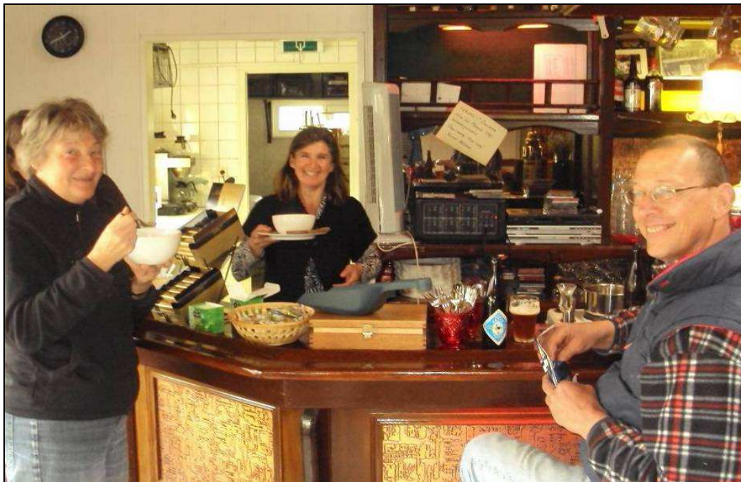
Italiaanse bonensoep met brood en roomboter