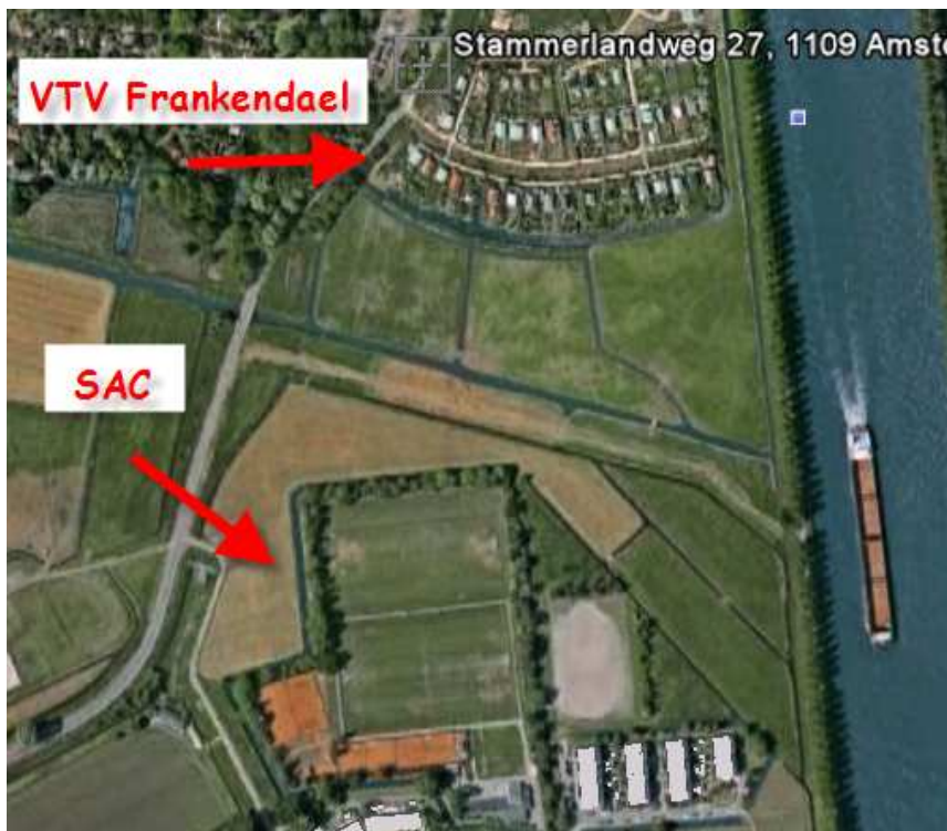
Hier is de huidige situatie van het sportcomplex Geinburgia te zien