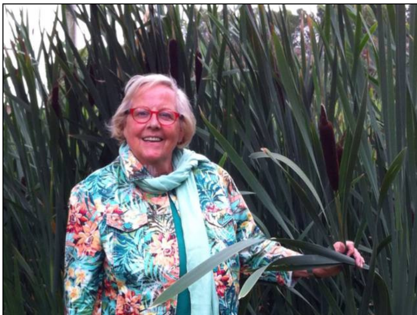
"Heerlijk wakker worden met het geluid van kikkers en vogels"

Haar Amsterdamse etagewoning ruilde ze enkele jaren terug voor een appartement in Amstelveen. Haar baan heet nu pensioen en daar heeft ze het ontzettend druk mee. Ze tennist driemaal per week bij de De Vliegende Hollander (DVH) in Amstelveen, draait mee in de barcommissie en doet mee met de organisatie van het KLM Open Tennis Toernooi. Ze is vrijwilliger bij de Wereldwinkel en gastvrouw bij Buitenplaats Westerd-Amstel. Ook wordt ze door vrienden en bekenden veel gevraagd om hulp te bieden bij grafische computerprogramma's én jawel, ze is al ruim 10 jaar lid van het Algemeen Bestuur Dorpsraad Driemond en is ook bestuurslid geweest van Frankendael. Maar met de verkoop van haar huisje zal ze ook haar bestuursfuncties in Driemond neerleggen.