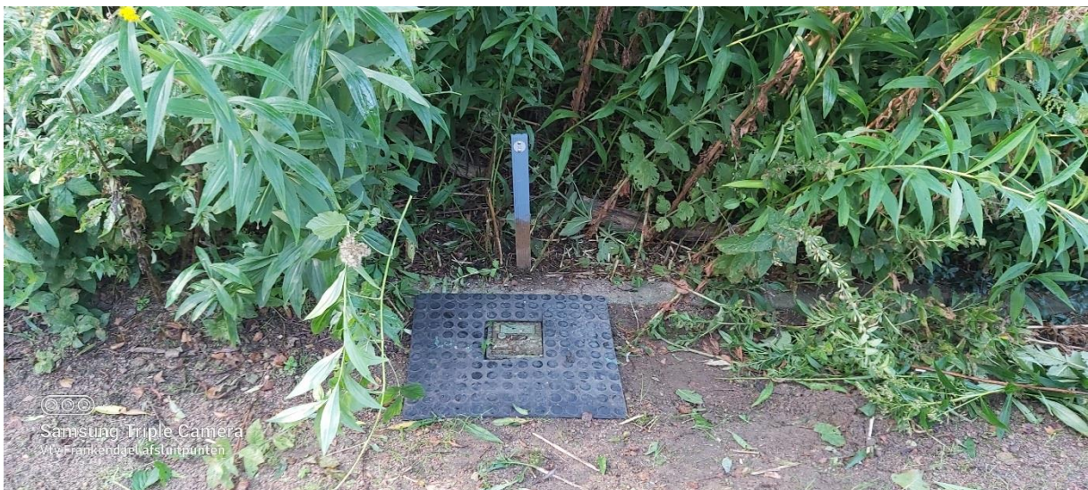
Afsluiter met paaltje en rubbermatje

Een vraag is voor ons nog waar de afsluitsleutels het best kunnen worden bewaard zodat iedereen erbij kan wanneer nodig.