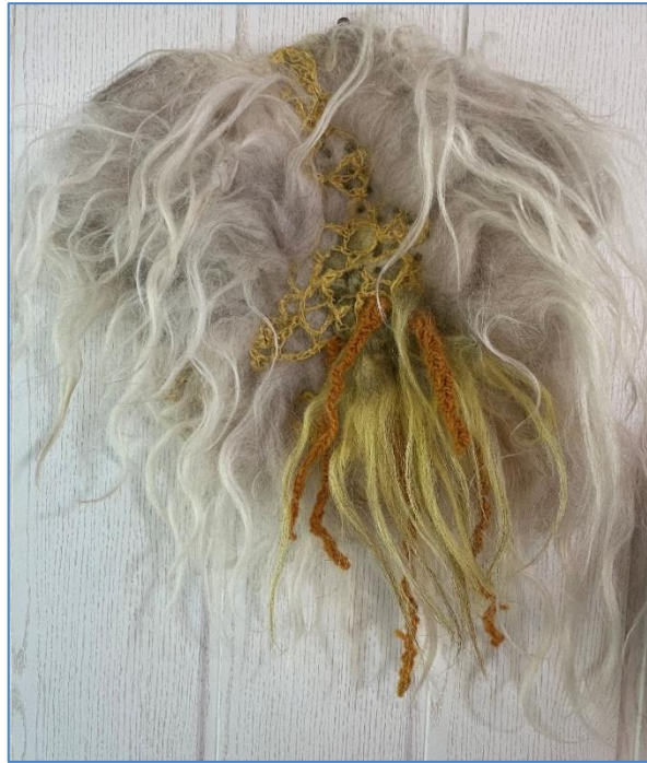
Harig zeebeestje van BEA ^

Een beeldimpressie van de zondagmiddag 22 september waarin tuinders een waardevol deel van hun leven delen.